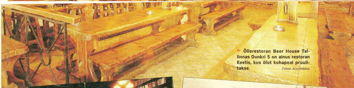
► Õllerestoran Beer House Tallinnas Dunkri 5 on ainus restoran Eestis, kus õlut kohapeal pruulitakse.